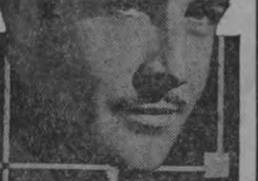
JOHN BOLES in Fox Pictures

A LAS 8.30 P. M. GIGANTESCO ESTRENO! El más sublime y el más doloroso de los dramas! DESTROZO SU VIDA POR SU AMOR . . . Y VIVIENDO EN EL PECADO SUPD GLORIFICARSE! . . . Los insignes artistas JOHN BOLES e IRENE DUNNE viviendo la más conmovedora tragedia pasional, titulada: